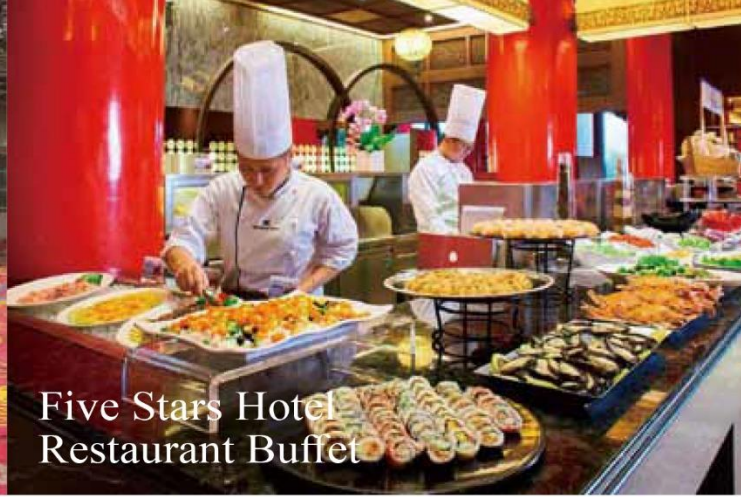
Five Stars Hotel Restaurant Buffet